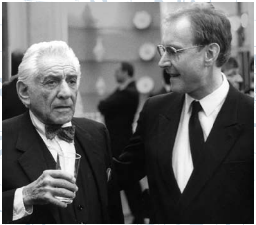
mit Leonard Bernstein