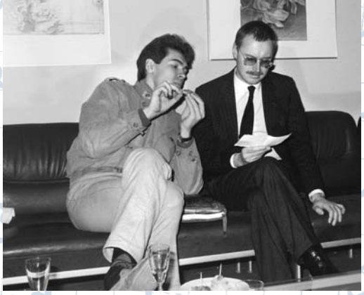
mit Ivo Pogorelich