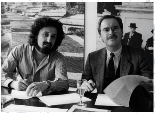
mit Mischa Maisky